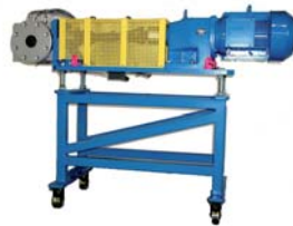
EXTRU pomp op wagen